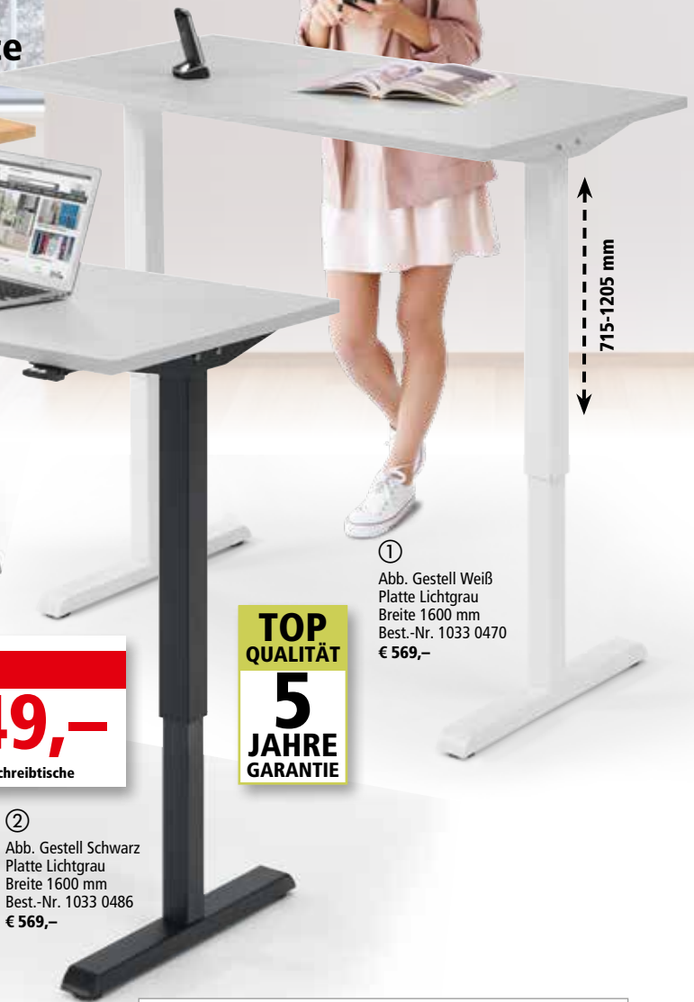
① Abb. Gestell Weiß Platte Lichtgrau Breite 1600 mm Best.-Nr. 1033 0470 € 569,-