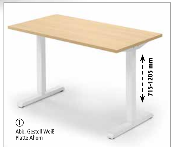
① Abb. Gestell Weiß Platte Ahorn

Bewegung ist wichtig! Allerdings haben nur die wenigsten Menschen die Möglichkeit, ihre Büroarbeit zu unterbrechen und den Bewegungsapparat in Schwung zu bringen. Immer mehr Menschen verfallen in Haltungsmonotonien und schädigen somit der Skelettmuskulatur. Fachärzte und Ergonomen empfehlen daher Schreibtische, die sowohl das Arbeiten im Sitzen als auch im Stehen ermöglichen.