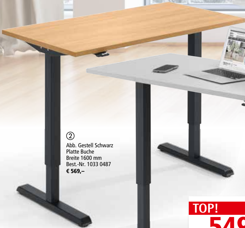
② Abb. Gestell Schwarz Platte Buche Breite 1600 mm Best.-Nr. 1033 0487 € 569,-

Tiefe 650 mm perfekt auch für das Home Office