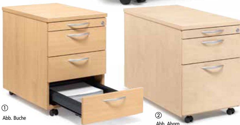
① Abb. Buche