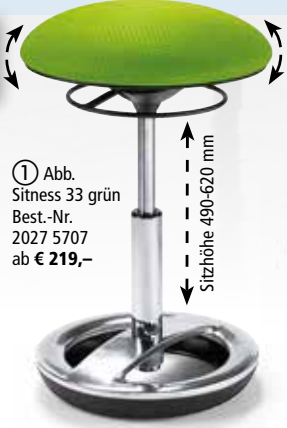
① Abb. Sitness 33 grün Best.-Nr. 2027 5707 ab € 219,-